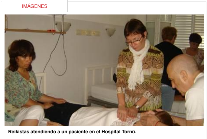
Reikistas atendiendo a un paciente en el Hospital Tornú.

Esta técnica japonesa de armonización natural ya se está aplicando como terapia para el dolor en el Hospital Tornú. Es gratis, ayuda a un menor consumo de analgésicos y disminuye la ansiedad. La generosidad en nuestras manos.